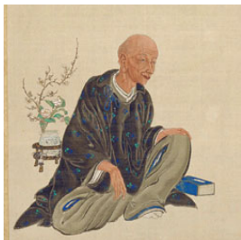
「杉田玄白 80歳の頃の肖像画」

この特別展では、『解体新書』の原本のほか、玄白が仲間の医師と交わした手紙を収めた『和蘭医事問答』の原本や、解体新書の原典となった『ターヘル・アナトミア』の複製資料などを展示します。あわせて、小浜や江戸の絵図、杉田玄白や蘭学に関する書籍なども展示し、福井県にゆかりの深い蘭学者・杉田玄白の業績を紹介します。